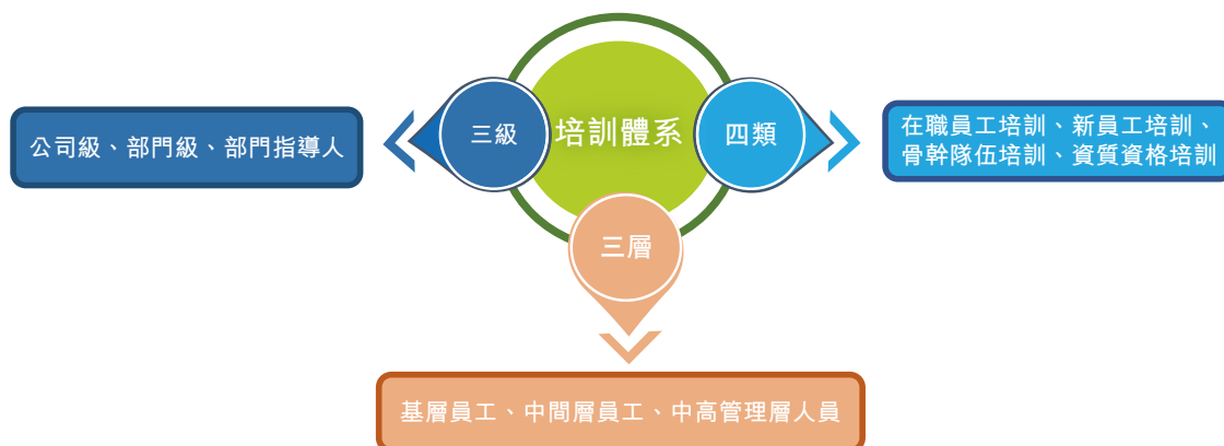
集團人才培訓體系

本集團制定實施《培訓管理制度》，構建了「三級」「四類」「三層」的培訓體系，培訓內容針對性覆蓋企業管理、領導力、資質認證、技能培訓、企業文化等內容，完善員工知識體系和技能水平，突出關鍵人才培養，為集團經營改善奠定了堅實基礎。此外，《培訓管理制度》還規定了培訓機制、培訓信息反饋內容，以保障培訓效果，不斷提升改進員工培訓工作。